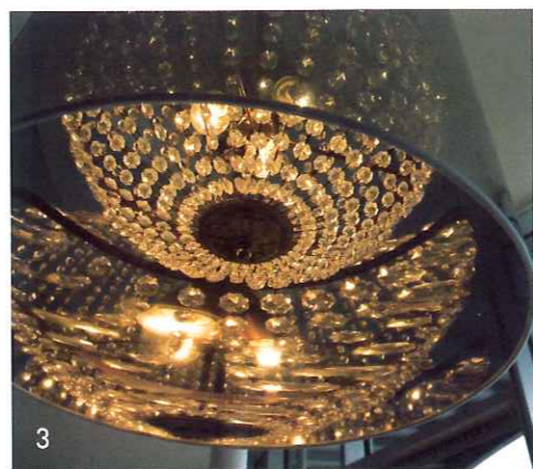
1. Lejlighedens største rum er ikke opdelt, men har skydedøre, der kan lukke af til arbejdsrum og soveværelse. Spisebord og stole er Eames fra Vitra, som fås hos Paustian. Kunst fra Christian Dam Galleries. 2. Etagerne slynger sig rundt og rundt kun afbrudt af de svævende trappereposer. De sorte døre leder ind til lejlighederne i forskellige størrelser. 3. Lampen Light Shade Shade har en indvendig krystallisekrone og en stor udvendig semitransparent skærm. Fra Moooi, fås hos Møller & Rothe.

I nogle år lå siloen forladt hen. Øde og ude af brug. Men netop den specielle stemning i havneområdet og ønsket om at bevare et stykke af byens historie blev frøsiloen comeback, omend i en ganske anden forklædning. I 1998 gik Københavns Kommune i gang med en lokalplan for området, og herefter blev det vedtaget at bevare de tre siloer samt Zeppelinerhallen, der oprindeligt var en luftballonhal.