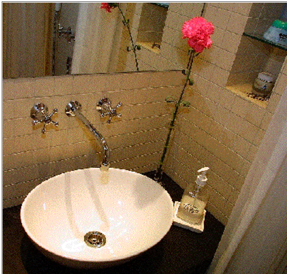
Håndvasken er en skål, placeret på en skifferplade.

På kun 150 x 85 centimeter er der blevet plads til det hele.