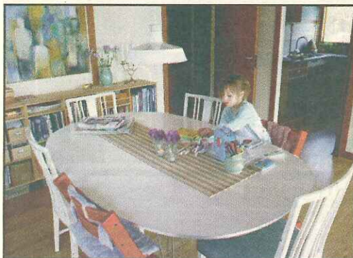
DET ER FINT, at spisebordet fylder meget. Så kan det bruges til leg, samvær og til kontor.

Med de skyhøje boligpriser kan det være svært for familien at få den plads, som den drømmer om. Når hjemmet er lille, stiller det store krav til den rette indretning.