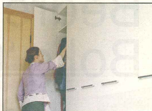
SKRÆDDERSYEDE SKABE, som når helt op til loftet, er også pladsbesparende.