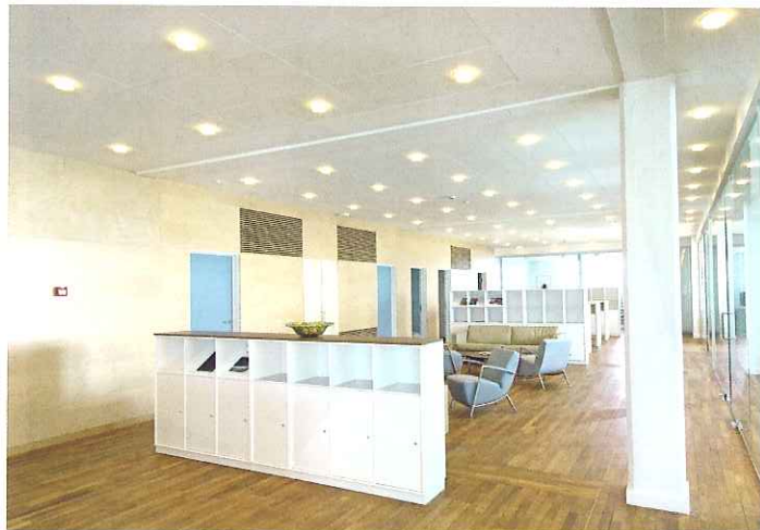
Trappen støtter trafikken og kommunikationen i investeringsbanken Capinordic på 3. og 4. sal. I en afsluttende finish ligger den harmoniske møblering fra FM Møbler i Ringsted med bl.a. Montana-reoler i farven Sne.

I fællesskab har de to indrettet et moderne finanscentrum på adressen. Det er sket i samarbejde med arkitekterne Skaarup & Jespersen A/S, og deres evne til at filtrere