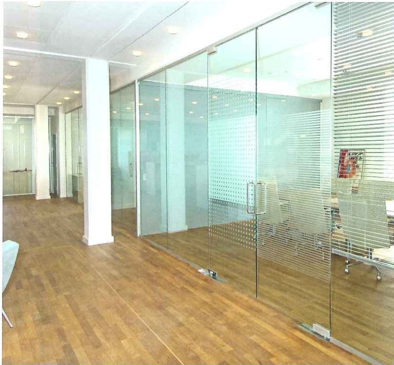
Hovedentreprenøren Juul & Nielsen A/S mestrede selv apteringens tømrer- og snedkerfag, mens el-entreprisen med bl.a. et aktivitetsbaseret IBI-anlæg var udliceret til Høyrup & Clemmensen A/S.

► der understøtter infrastruktur og kommunikation i Capinordic. 4. salen – den midterste af de tre – deles med Horwath Revisorerne, således at begge virksomheder har servicecenter med receptions- og loungefaciliteter og konference- og mødelokaler her, mens de på etagerne henholdsvis under og over har de daglige arbejdspladser.