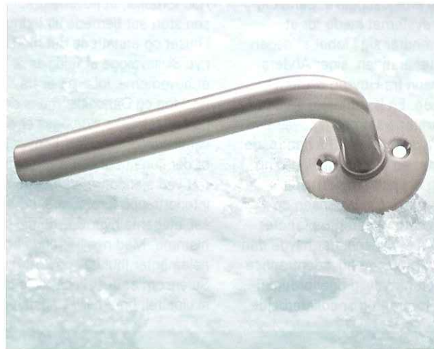
Styrke og gennemtænkt design gør det nye dørgreb Ruko-Line til en holdbar løsning for kvalitetsbyggerier.

Få inspiration til markedsføring af din virksomhed på online versionen af byggebranchens førende projektmagasin