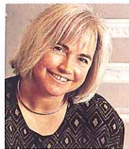
Af Myrna Havn

I modsætning til NCS-systemet fortæller RAL-koden næsten intet om farvens udseende. Ofte må man bruge sit farvesyn for at ramme den rette nuance.