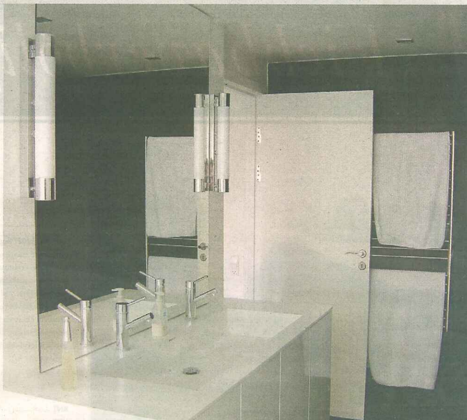
En flot og anderledes loftbelysning over brusenichen