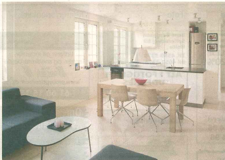
Et mellemstort bord som giver plads til den daglige brug, både spising og leg. Og som kan slås ud og gøres større til gæster