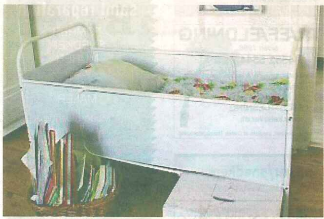
Udtrækssenge som kan følge barnets alder.

Justerbare hylder gør det nemt at flytte dem efter behov.