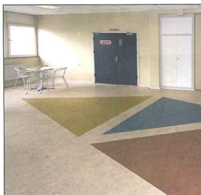
På en af de andre etager på skolen ses dette mønster i et fællesområde til hygge og uformelle møder.